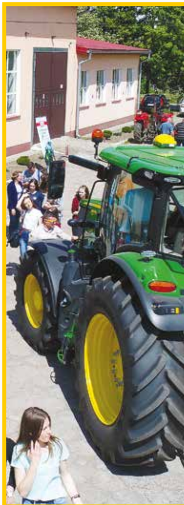
Posiadamy nowoczesną bazę dydaktyczną.

www.zsnr1bialapiska.pl Biała Piska, ul. H. Sienkiewicza 16 Tel./faks: (87) 425-91-60 sekretariat@zsnr1bialapiska.pl