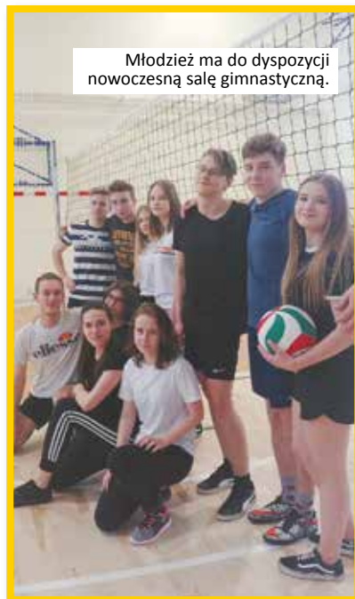
Młodzież ma do dyspozycji nowoczesną salę gimnastyczną.

W ramach współpracy z Wojskową Akademią Techniczną nasi uczniowie uczestniczą - w zajęciach warsztatowych; - w zajęciach laboratoryjnych; - w seminariach.