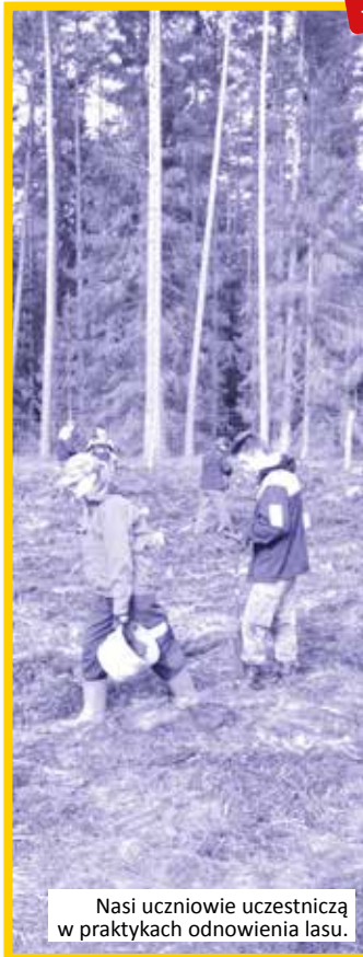
Nasi uczniowie uczestniczą w praktykach odnowienia lasu.

Nasi uczniowie biorą udział w różnych zawodach, konkursach i olimpiadach. Kładziemy nacisk na wszechstronny rozwój młodzieży.