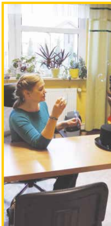
W gabinecie logopedy.

Prowadzimy psychologiczny punkt konsultacyjny dla rodziców i nauczycieli.