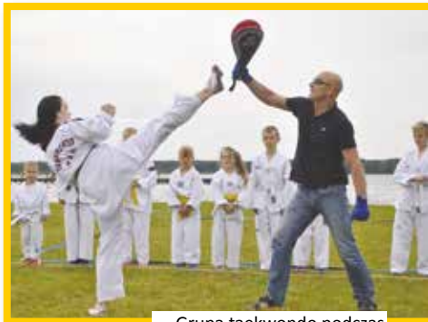
Grupa taekwondo podczas pokazu swoich umiejętności.

www.pmos.pisz.pl Pisz, Al. Turystów 22 Tel. (87) 423-45-72 bazamos@wp.pl