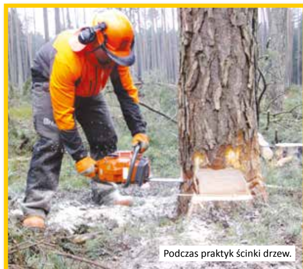
Podczas praktyk ścinki drzew.